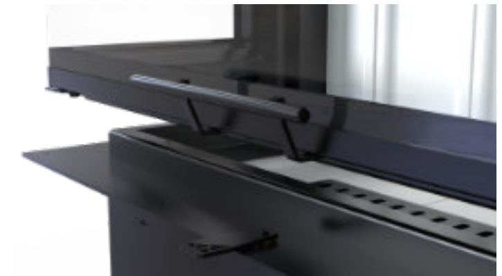
Klamka wkładów typu gilotyna - czarna