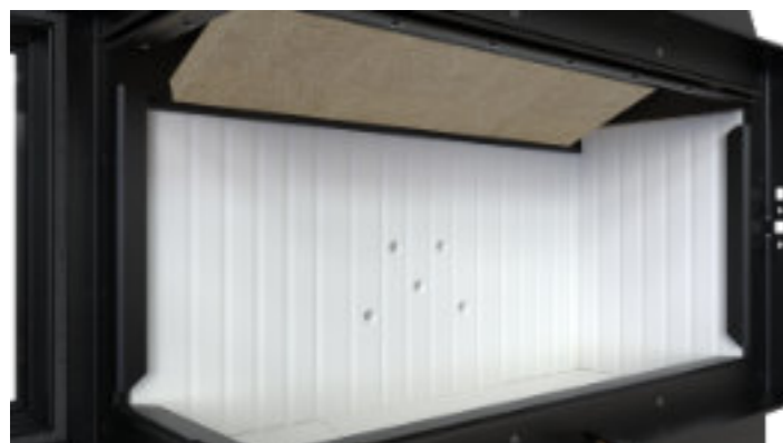
Jasny ceramiton - w standardzie