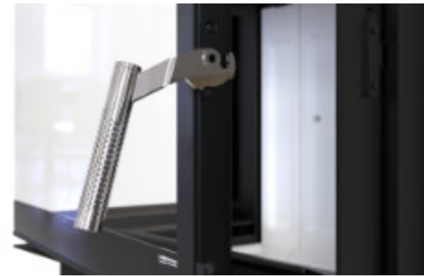
Zimna klamka Cool&Touch - polerowana