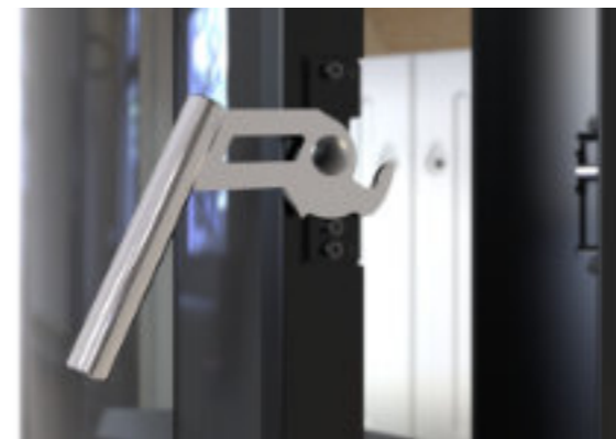
Klamka piecyka - polerowana