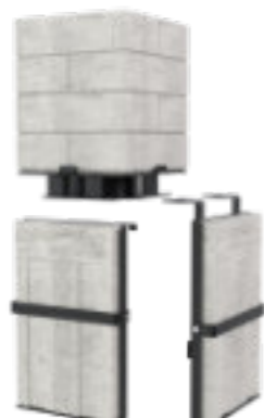
Dostępny w wersji dla Defro Home Intra oraz Defro Home Impuls