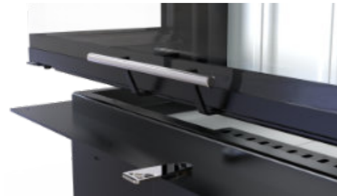
Klamka wkładów typu gilotyna - polerowana