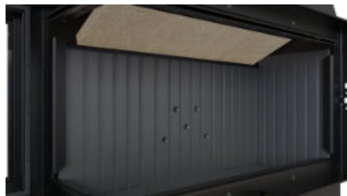
Czarny ceramiton - opcja