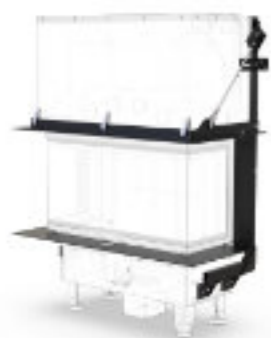
Rama nośna - wersja z parapetem