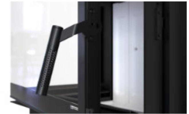
Zimna klamka Cool&Touch - czarna