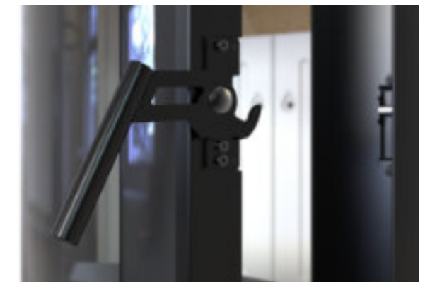
Klamka piecyka - czarna